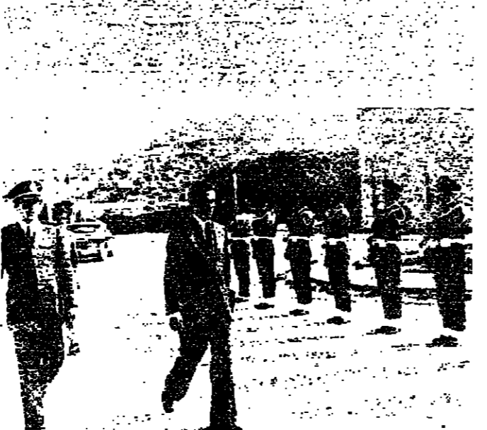
استقبل الرئيس سليمان فرنجية امين ، سفير الاردن في لبنان السيد وليد صلاح الذي تناول طهما اعداءه الى مكتبته . وقسم السفير : زوت الرئيس فرنجية للاطمنان على اوضاع لبنان والاقتصاد الى ما وصلت اليه . وتبين ان يكون الانسراج تريبا وعاجلا ونعمود الاوضاع السى طبيعيها وبعض البندون كمانثتها . وفي الصورة يبدو السفير لدى وصوله الى النصر .

دعا المكتب الدائم لاتحاد المحامين العرب المنعقد في بغداد من ٢٤ الى ٢٧ كانون الاول الجاري اعماله واصدر قراره ونصته . وتناولت اجنات المكتب الدائم اوضاع لبنان واصدر بشأنها القرار الاتى : ان المكتب الدائم لاتحاد المحامين العرب المنعقد في بغداد من ٢٤ الى ٢٧ كانون الاول ١٩٧٥ يظل باضمام زلت منذ تسعة اشهر تمنع في نزف هذا البلد العربي ويخشى بالقتل والتخريب وانتهك الحريات الاساسية . واذ يرى المكتب هذه الاحداث كخطوة خطيرة على قضايها العرب وفي طليعتها قضيتهم الكبرى فلسطين ، يدعو الى وقف النزف الاخرى على الارض اللبنانية والحضارة ورحمة بالارباب والصرا للصفحة الحضارية الفريدة التي جعلت من لبنان دولسة ديمقراطية تعلمش فيها باقة وانفتاح الطوائف والمعتقد المختلفة . كما يدعو المكتب الدائم الى التمسك باستقلال لبنان وسيادته ووحدة شعبه وازمامه وحمايته من كل تهديد وواجبه وواجب الشعب الفلسطيني اتميم على ارضه .